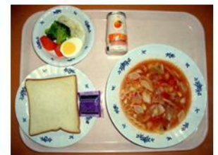
【朝食例】 ミネストローネ・温野菜サラダ