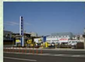
●七十七銀行八幡支店