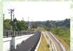
●広瀬川沿いジョギングコース