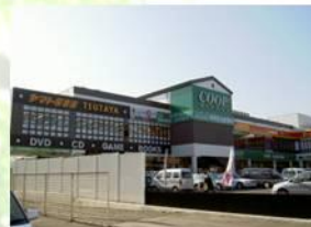
●レキントンプラザ (COOP・TUTAYA等)