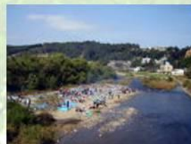
●広瀬川 (学舎会の風景)