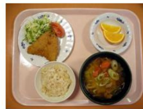
【夕食例】 アジフライ・豚汁・十穀ご飯

食生活は健康づくりの基本です。しかし一人暮らしではバランスを失いがち。朝ごはんを食べないと、十分なエネルギーが補給されないため、脳や体へのエネルギーが不足してしまいます。そのため、脳の動きが悪くなり学習能力が低下したり、また、体温が上がらず活動力が低下してしまったり・・・。米国のある大学の調べでは、朝食を食べない学生よりも朝食を食べた学生のほうが問題行動・非行行動が少なかったそうです。また、朝食を食べていなかった学生に朝食を食べる習慣をつけると数学の成績が高くなったとのこと。食事バランスにおいては、野菜の摂取不足、脂質や食塩の摂り過ぎによる肥満や生活習慣病の増加が心配されます。主食、副菜、牛乳・乳製品、果物の5グループの食品をバランスよく摂れないとバランスが崩れてしまいますね。エクレール青葉の食事は栄養士が献立を考え、館内で調理された温かい料理です。メニューも和食、洋食などバランスのとれた身体に優しい美味しい料理ばかり。一日の始まりは朝食から。規則正しい食生活をお送りいただけます。また、ご飯とお味噌汁はお替り自由。食べ盛りのお腹をサポートします。