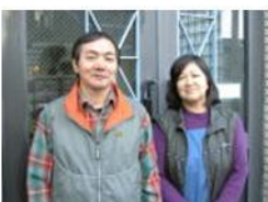
【管理人の須江夫妻】