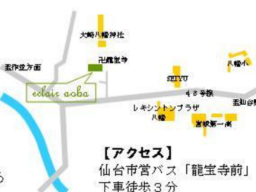
【アクセス】 仙台市営バス「龍宝寺前」 下車徒歩3分

常駐管理人が、近すぎず遠すぎず。あなたの学生生活を温かく見守ります。いざという時、もしもあなたが一人では解決できない問題に直面した時は気軽に声を掛けてください。「環境問題に関心があるので興味のある人はお話ししたいですね」