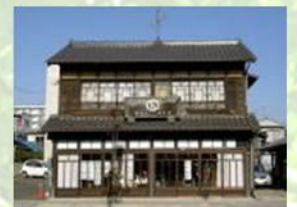
●江戸末期創業の庄子屋醤油店